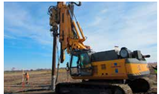
South Dundas Wind Project Brinston, Ontario