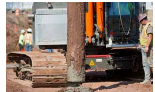
North Hartford Minor League Ballpark North Hartford, Connecticut