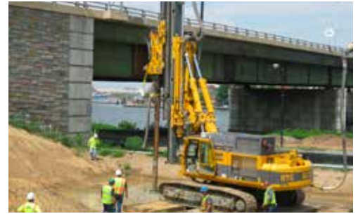
11th Street Bridge Washington, D.C.

©2016 Geopier Foundation Company, Inc. La tecnología Geopier® y las marcas de fábrica están protegidas bajo patentes de los EUA y marcas de fábrica listadas en www.geopier.com/patents y otras aplicaciones de marca y patentes pendientes. Existen otras patentes extranjeras, aplicaciones de patentes, marcas registradas y marcas de fábrica.