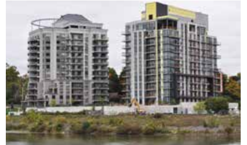
The Grand Condo Cambridge, Ontario